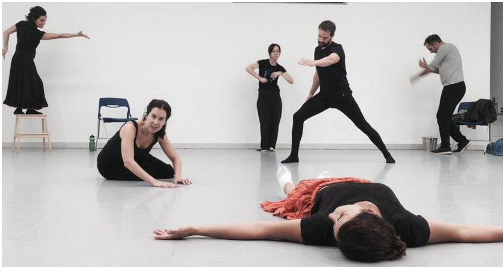
“El Arte Transforma, Transmite y Trasciende”

Todo es uno, y requiere de un estudio holístico, de estudio práctico y teórico, pero también de investigación personal. El conocimiento solo ocurre dentro de cada alumno si éste es parte activa, y a través del encuentro con el trabajo, las teorías que estudiaremos, el profesor y el otro.